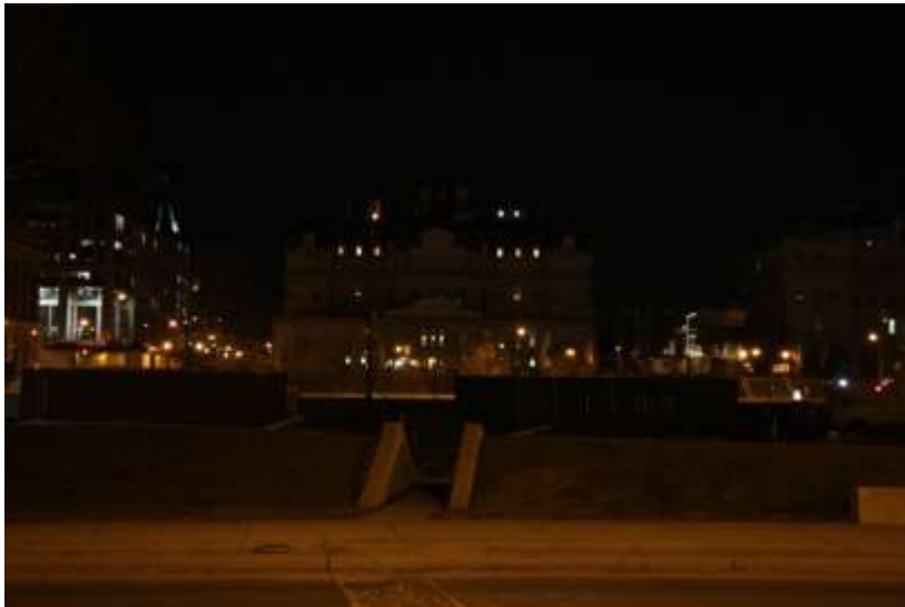
Mairie de Montréal

MONTRÉAL – Le Ministre de l'environnement a présidé la célébration officielle. Partout à Montréal, des édifices emblématiques ont éteint leurs lumières, incluant l'Hôtel de ville et le Centre Bell. Une marche aux chandelles a été organisée sur le Mont-Royal.