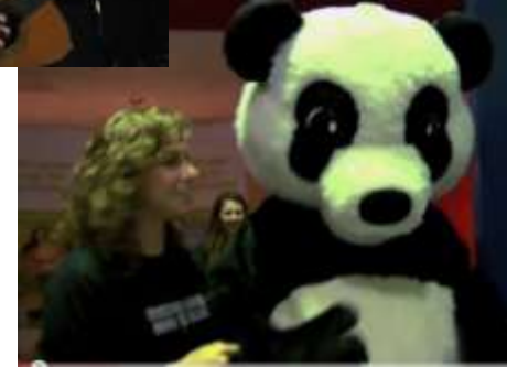
HALIFAX – Nos collègues du bureau de Halifax ont organisé un concert intime aux chandelles