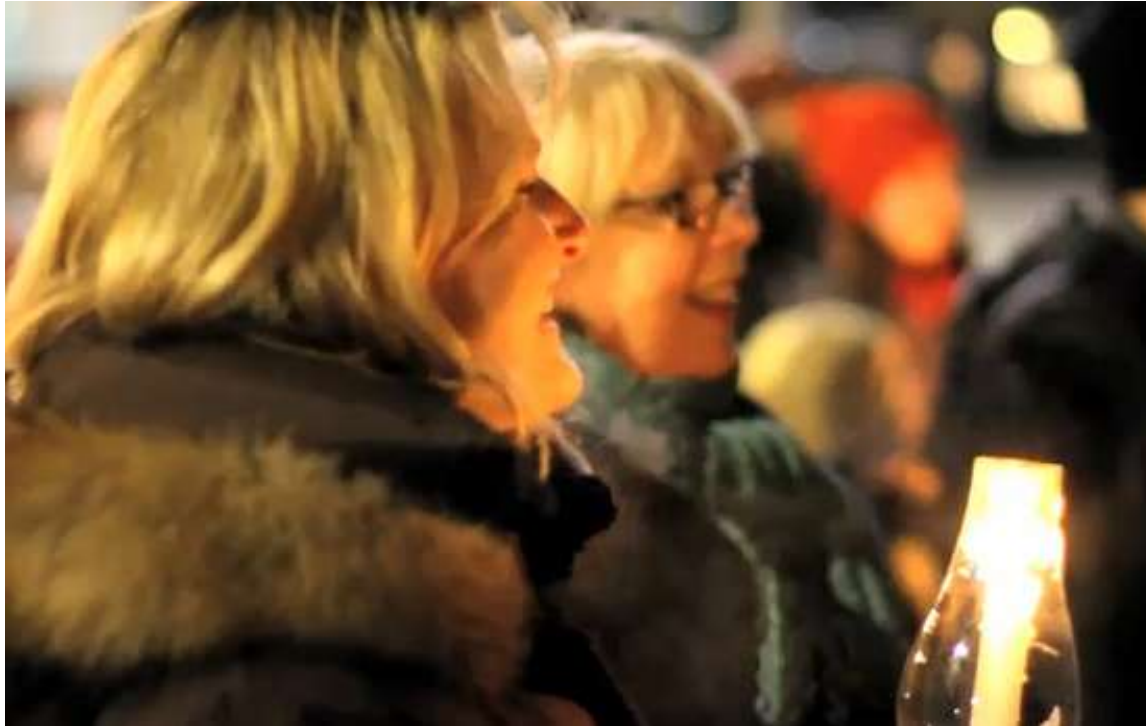
TORONTO – Un groupe de citoyens engagés se sont rassemblés pour une marche aux chandelles