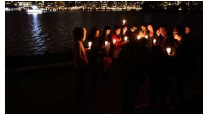
VANCOUVER – Des personnes ont célébré aux chandelles au Parc Stanley.