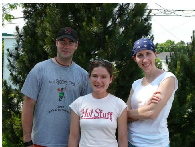
Équipe mobile 2007-2008

Les deux intervenants formant la caravane seront aussi présents lors de la réalisation de la fête des SAE prévue en août prochain. Voici un été qui promet d'être fort actif!